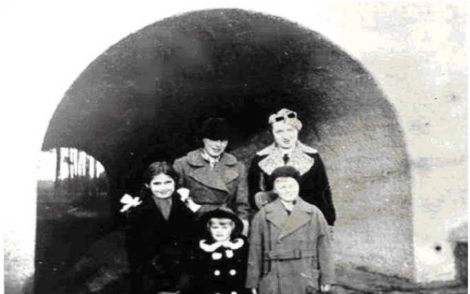
Am Theatertunnel

Beim Autobahnbau (etwa 1935-38) fügte man eine Unterführung ein, die es ermöglichte, das Freilicht-Theater gleich südlich hinter der A 10 bei den Patzer Bergen, ungefährdet zu erreichen. Von der Feldstraße aus führte ein Weg, Theaterstraße genannt, direkt zu diesem „Theatertunnel“, wie ihn die Michendorfer getauft hatten.