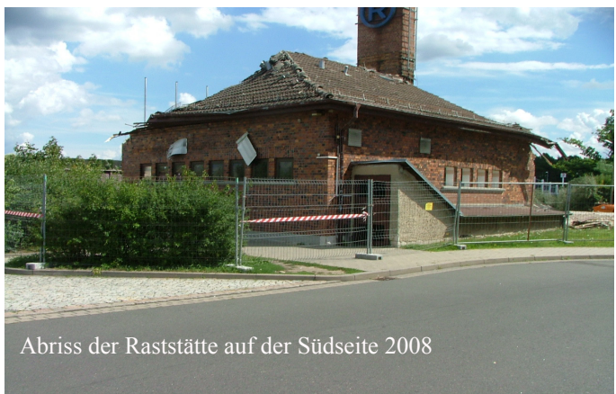
Abriss der Raststätte auf der Südseite 2008