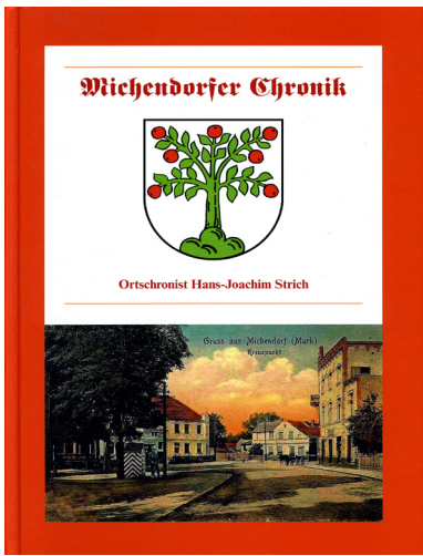
Die „Michendorfer Chronik“ ist zur Zeit vergriffen