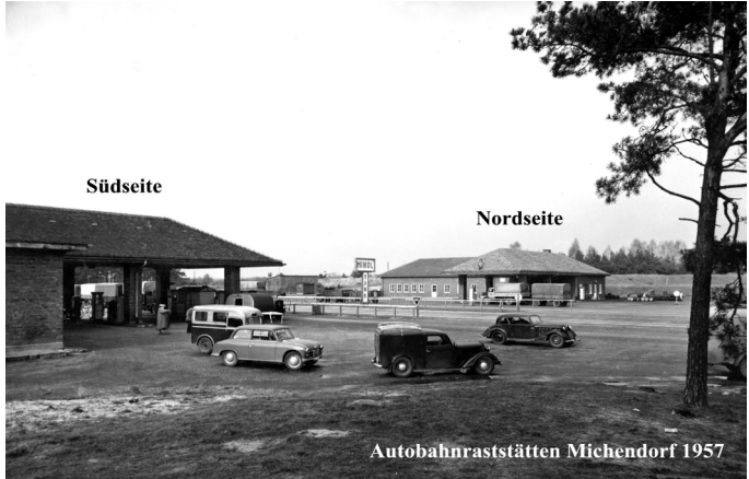
Autobahnraststätten Michendorf 1957