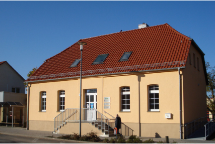
Potsdamer Straße 57

Jeden 2. Sonntag im Monat von 14 - 16,30 Uhr Die Mühle ist zu erreichen: Eingang Langerwischer Straße